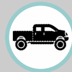
Mobil Double Gardan