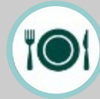
Makanan Siap Saji