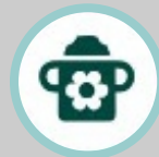
Makanan Balita & Anak